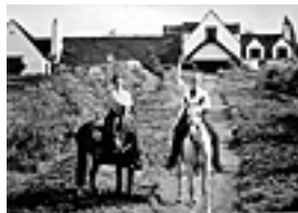
Between concerts and recitals LL was home with Frances in Santa Barbara